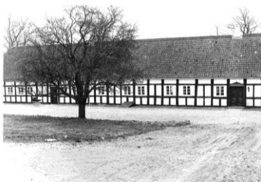
Kirkevej 30 B, Hornslet (Hornsløkke) (Foto: J. Nørgaard, 2004)