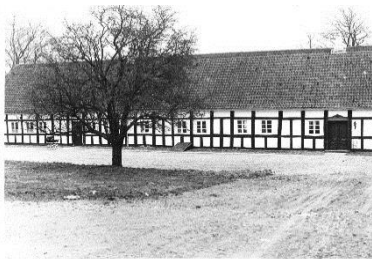
Gårdsvej 30 B, Hornslet Kirkegårdsvej. (Foto: J. Sjøholm, 1998)