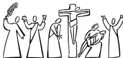
Påskeugen fortalt i billeder

Påsken har det hele, så om man vælger at tage hele turen fra palmesøndag til Påskemorgen, eller om man finder den gudstjeneste, der passer bedst, så er kirken åbne netop for dig. Rigtig glædelig påske!