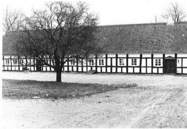
Gårdsvej 30 B, Hørne (Hørneskolen).